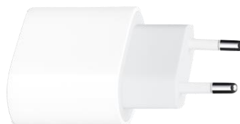
Apple USB-C- lichtnetadapter van 20W