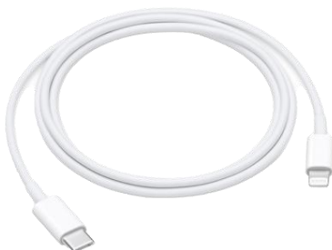
Apple USB-C-naar-Lightning- kabel (1m)