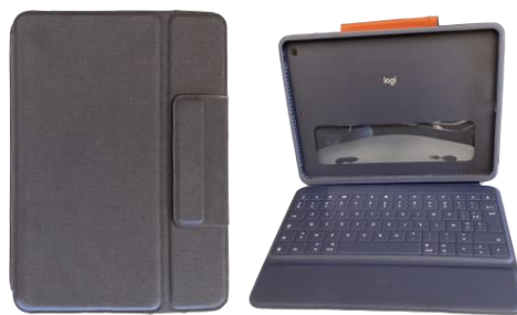
Beschermhoes met toetsenbord (Logitech Rugged Combo 3)